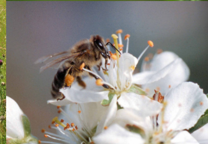
Preisgekrönte Pfefferkorn-Wiesen in Bludesch: Schwalbenschwanz. Biene auf Zwetschke.